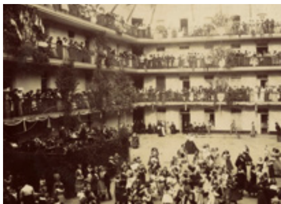
Figur 1 Fest på innergården i Familistären i Guise 1907.