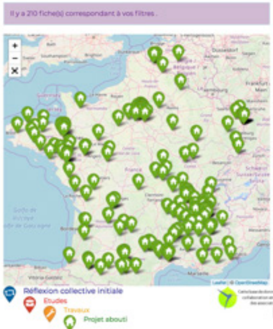
Figur 5 Interaktiv karta över bygg- och bostadsprojekt i Frankrike. Bakom symbolerna finns en kort beskrivning av projektet.

Kartan är sökbar vad gäller hur långt byggprojektet kommit, gruppens läge, tillgången till mark, projektets lokalisering, upphandlingsmodell, juridisk status och geografiskt läge/län (källa habitatparticipatif-france.fr).